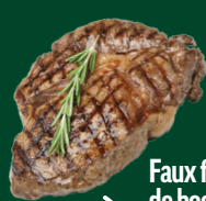
Faux filet de boeuf